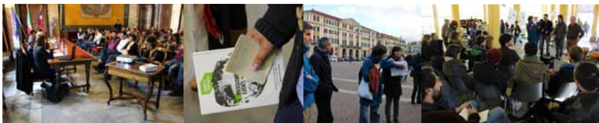
Workshop à Cuneo, du 10 au 19 octobre 2013

À la suite du workshop qui s'est tenu à Cuneo, du 10 au 19 octobre derniers, les 19 artistes français et italiens sélectionnés et nos partenaires italiens, se sont retrouvés à Nice dès le mardi 19 novembre. Ce temps de travail commun leur a permis de découvrir le territoire, et de façon plus précise le marché de la Libération. Une série de rencontres avec nos partenaires et des experts dans différents domaines (art, environnement et autres disciplines concernées par le projet) leur a donné des clés d'analyse et de réflexion autour du contexte de la manifestation.