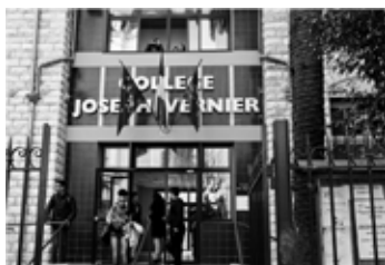
PHOTO AU COLLÈGE

VERNISSAGE VENDREDI 19 SEPTEMBRE DE 16H30 À 20H30