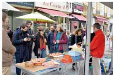
Workshop à Nice dans le cadre de Market Zone, découverte du marché de la Libération.